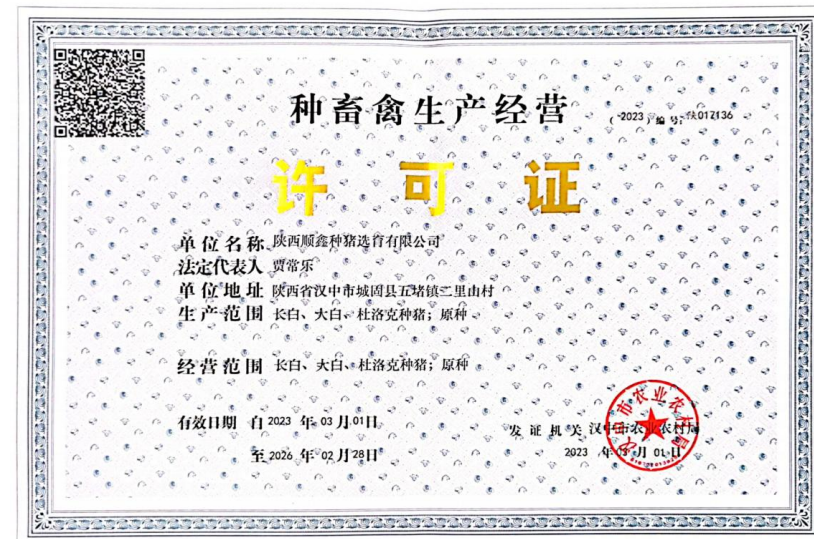
长白 大白 杜洛克原种