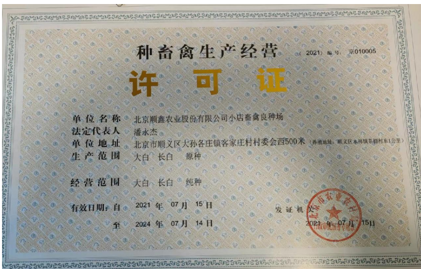
大白 长白 原种