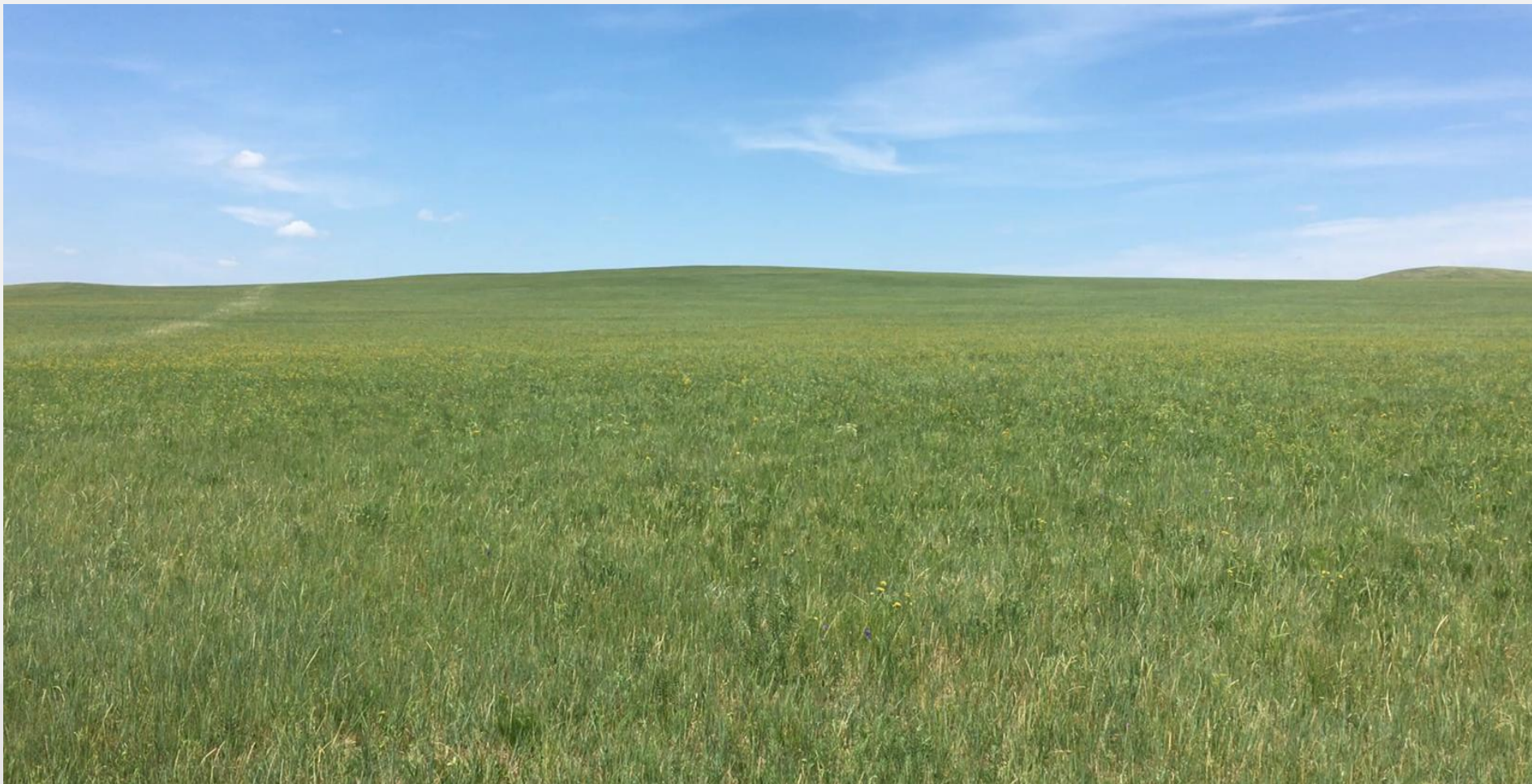
最美的草原——内蒙古乌拉盖大草原