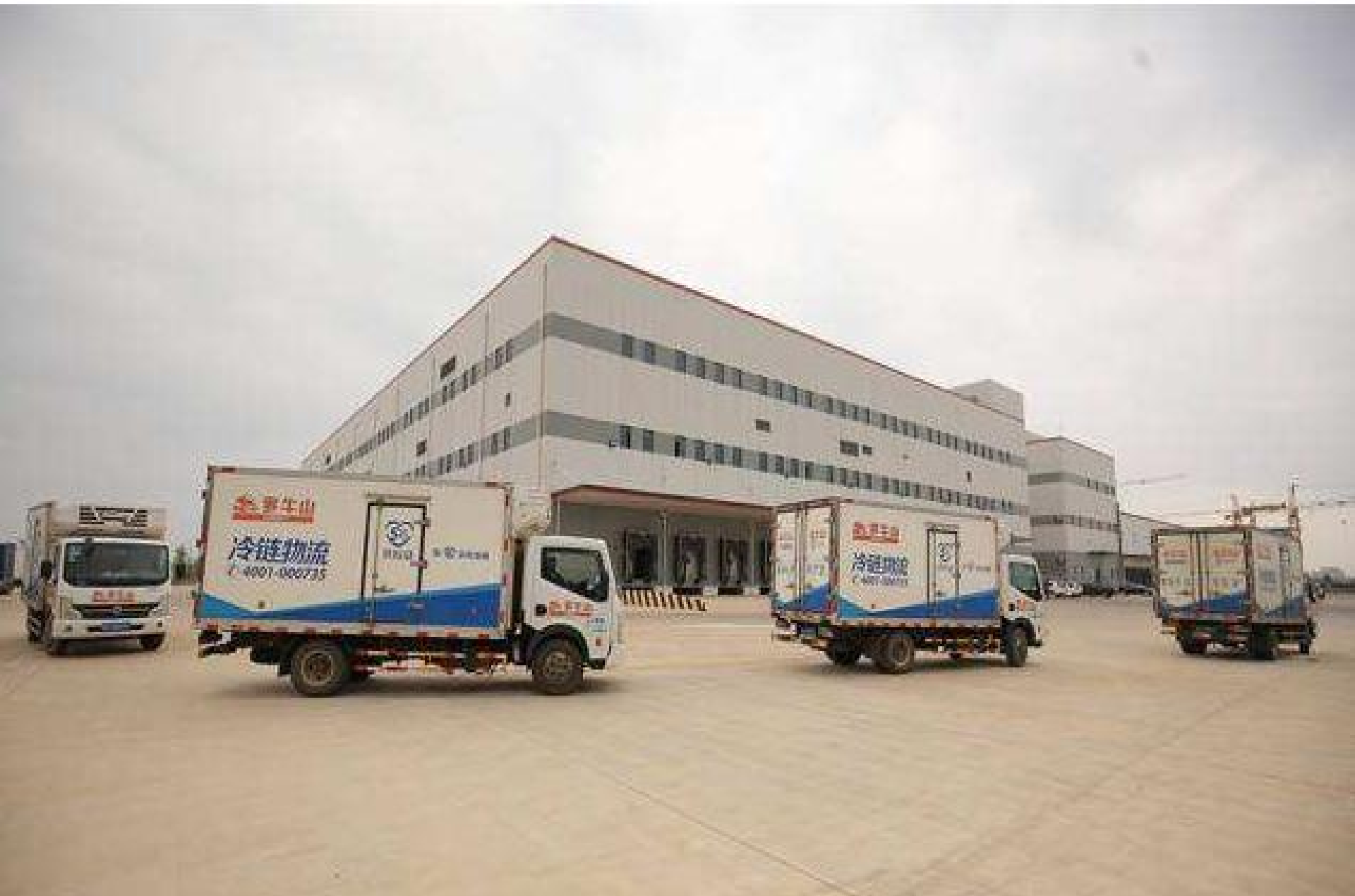
罗牛山产业园----30万吨高低温冷库