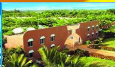
罗牛山1.5万头育种场