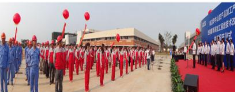
产业园屠宰项目投产仪式现场