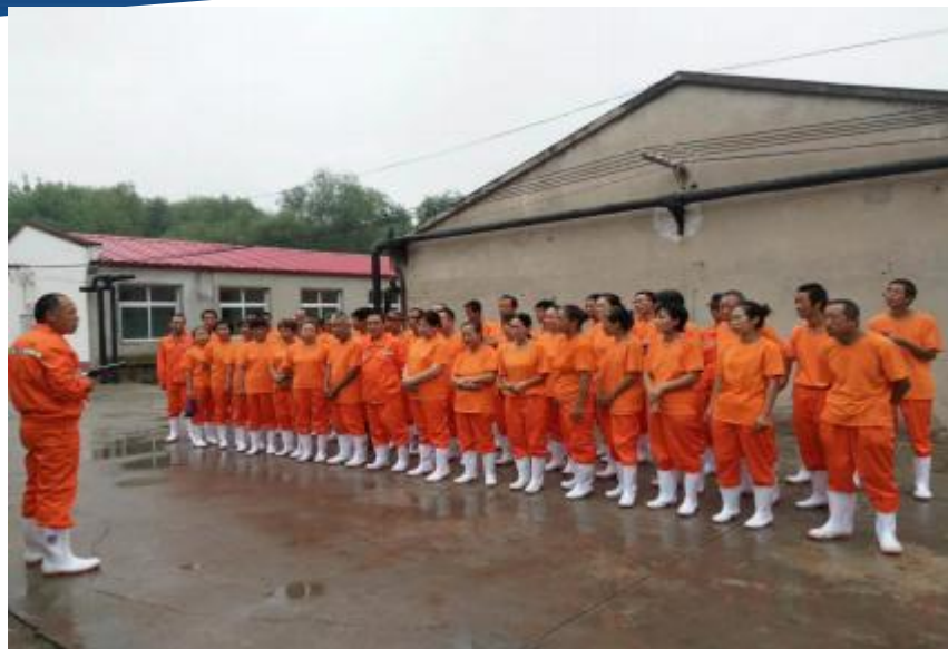
加强员工生物安全防控意识